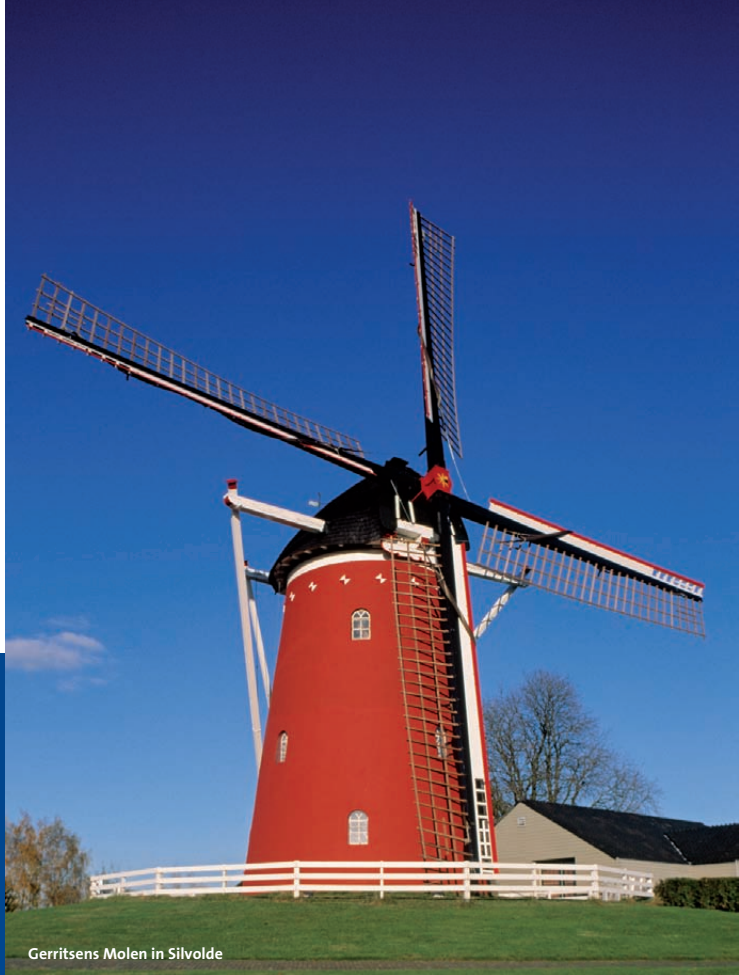
Gerritsens Molen in Silvolde

Zowel De Grafelijke Toren-molen 5 als de naastgelegen Rosmolen Zeddam 6 , behoorden toe aan de graven van het kasteel Huis Bergh te 's-Heerenberg. Binnen het feodale rechtssysteem konden de adellijke heren sinds de twaalfde eeuw het 'dwangrecht' doen gelden; de verplichting aan de boeren in hun rechtsgebied om hun graan te laten malen op de molens van de lokale heersers. Het doel hiervan was om belasting te heffen, waarbij bijvoorbeeld een tiende deel van het meel aan de heer moest worden afgedragen.