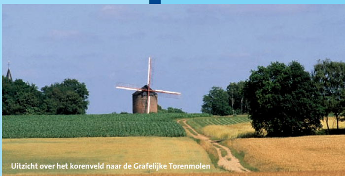
Uitzicht over het korenveld naar de Grafelijke Torenmoln

De moln door de vang laten lopen = Alles loopt in het honderd