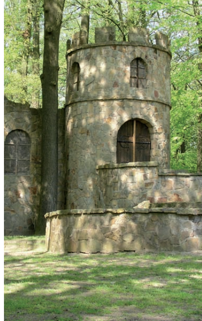
Een 'faux château' als decor van Openluchttheater Hertme

5 Almelo ligt aan een riviertje, de Loolee. Als u de Gravenallee voor de tweede keer kruist, aan